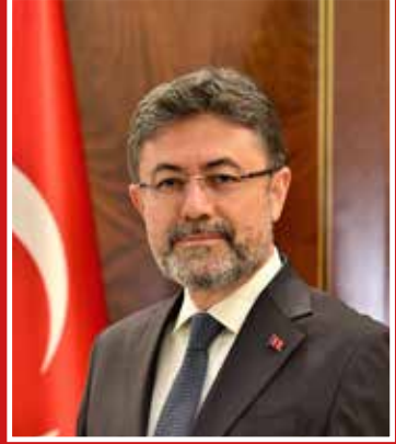
İbrahim YUMAKLI Tarım ve Orman Bakanı

Bu çerçevede, üreticilerimizin karşılaşılabileceđi sözleşmeli üretimden kaynaklanan uyuşmazlıkların kısa sürede çözümünde yol gösterici olması amacıyla Bakanlığımızca "Sözleşmeli Tarım Uyuşmazlıklarında Arabuluculuk Rehberi" hazırlanmış olup üreticilerimize faydalı olması dilek ve temennisiyle ülkemiz tarımına hayırlı olmasını dilerim.