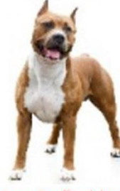
American Scaffordshire Terrier