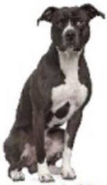
American Pitbul Terrier